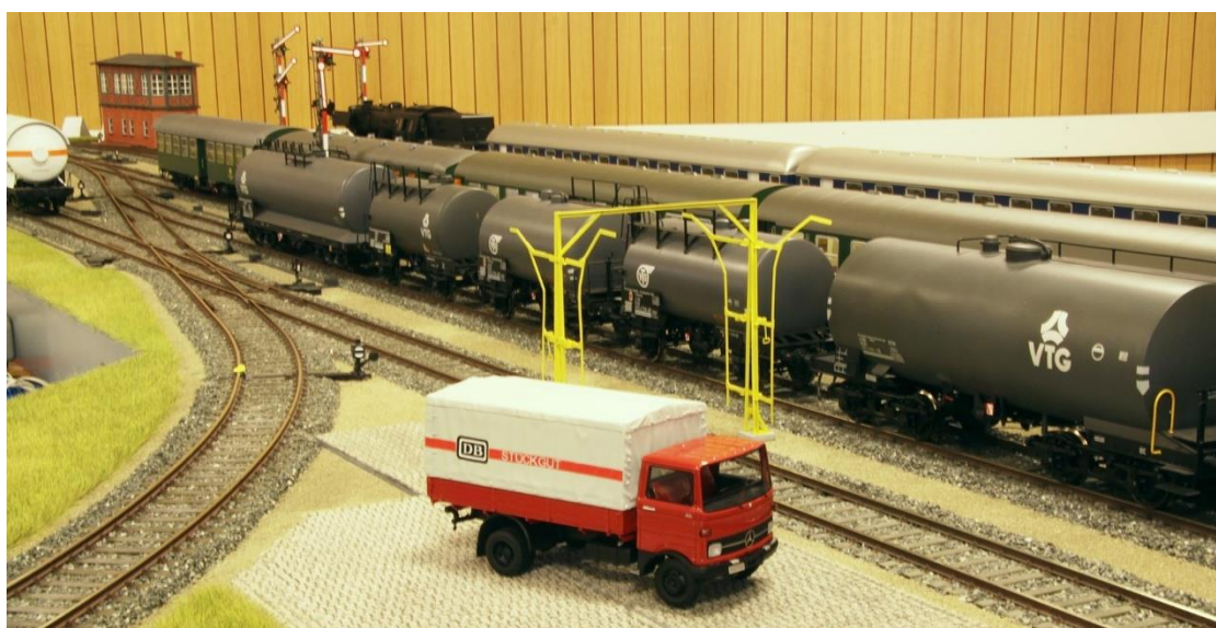
Bild 6: Der kleine Güterbereich mit Abstellmöglichkeit grenzt direkt an den Bahnhof an.

Weiter Bilder finden Sie auf unserer Internetseite www.mef-markdorf.de/spur1.html .