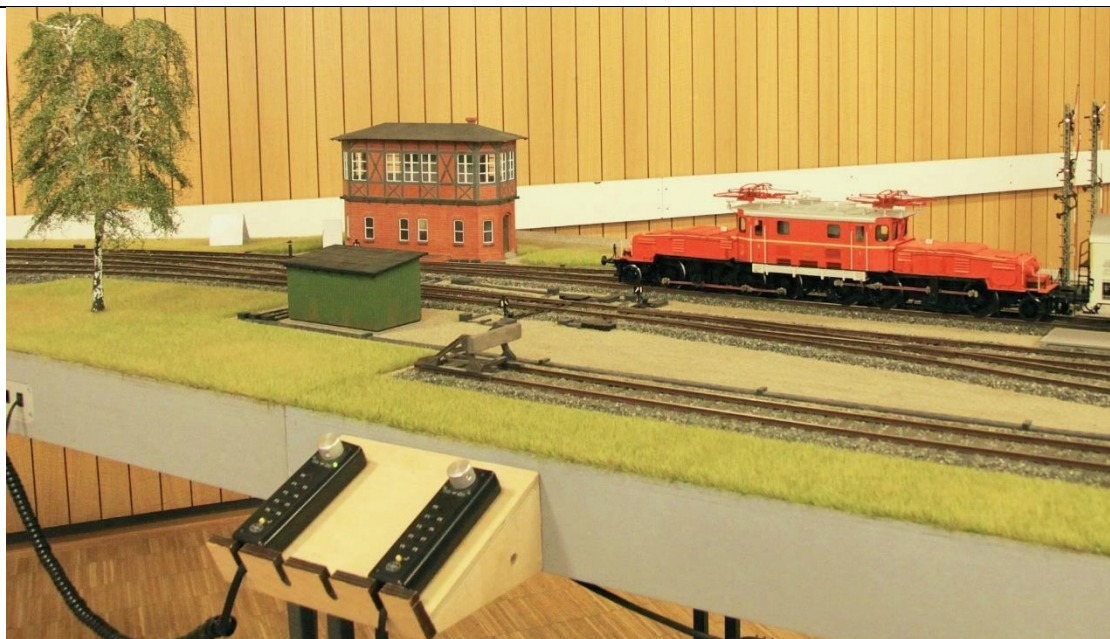
Bild 5: Das Krokodil verlässt den Bahnhof und fährt am Stellwerk vorbei.